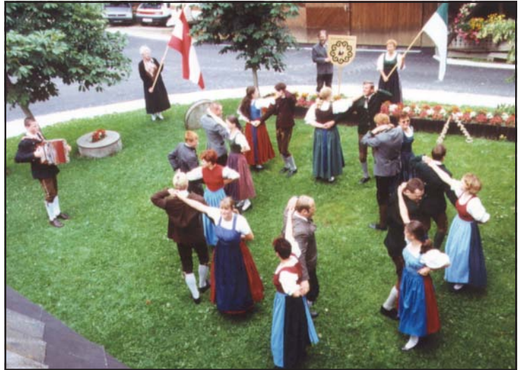
A da Feistritzer Landler darf nit föhln, wann ma wü a bissal wos zur Schau stölln.