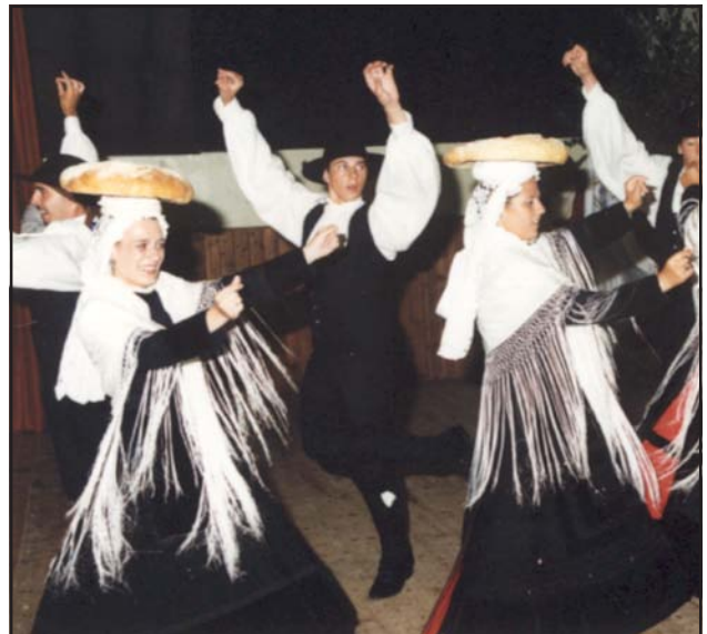
Die Spanier tanzten mit recht viel Schwung - das hält jung.