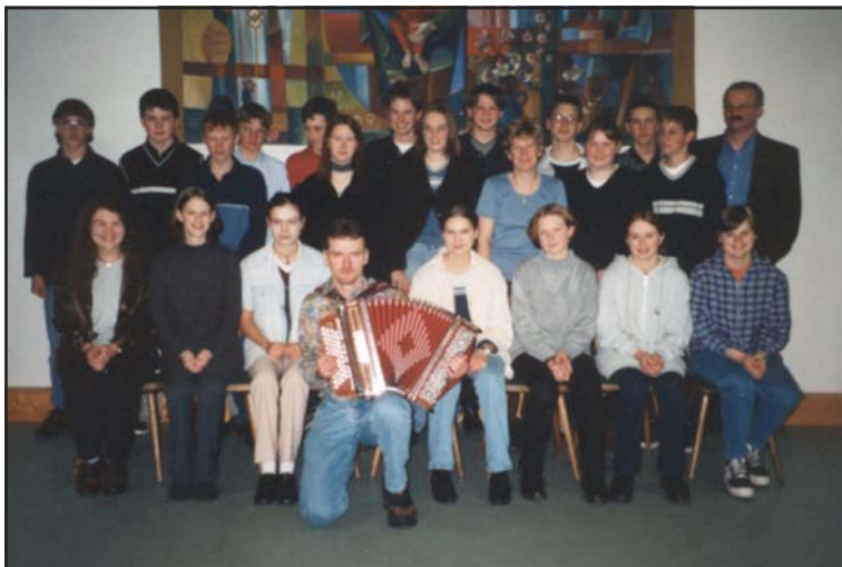
Steirisch Tanzkurs 1998

Au weh mei Fuaß, wenn i orbeiten muass, koa Fuaß tuat ma weh, wann i zan Tounz ausgeh.