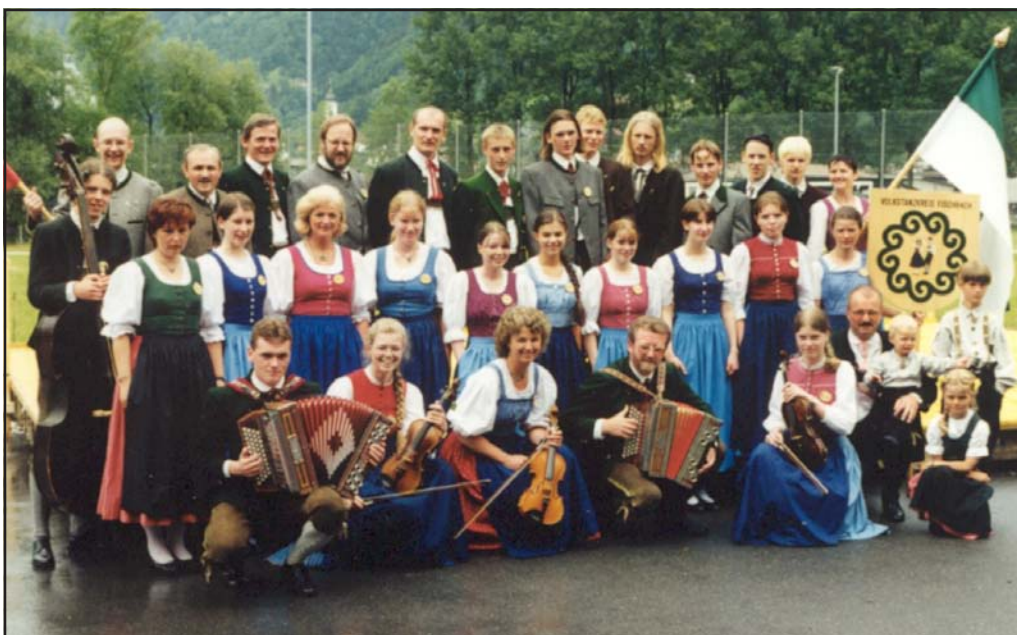
In Flüelen - Schweiz (1998) hat man uns auch mit der Linse erwischt.