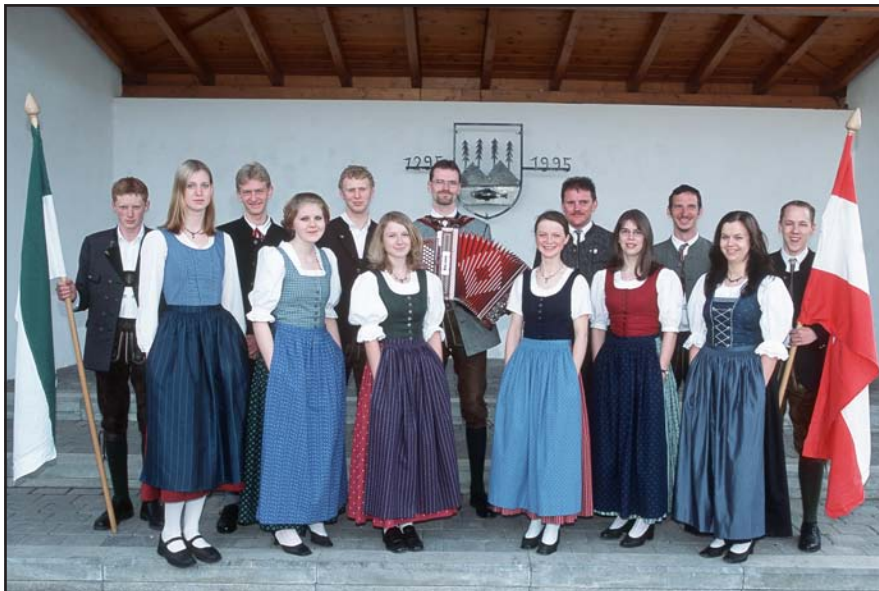
A Gruppe mit Charme, Schwung und Elan