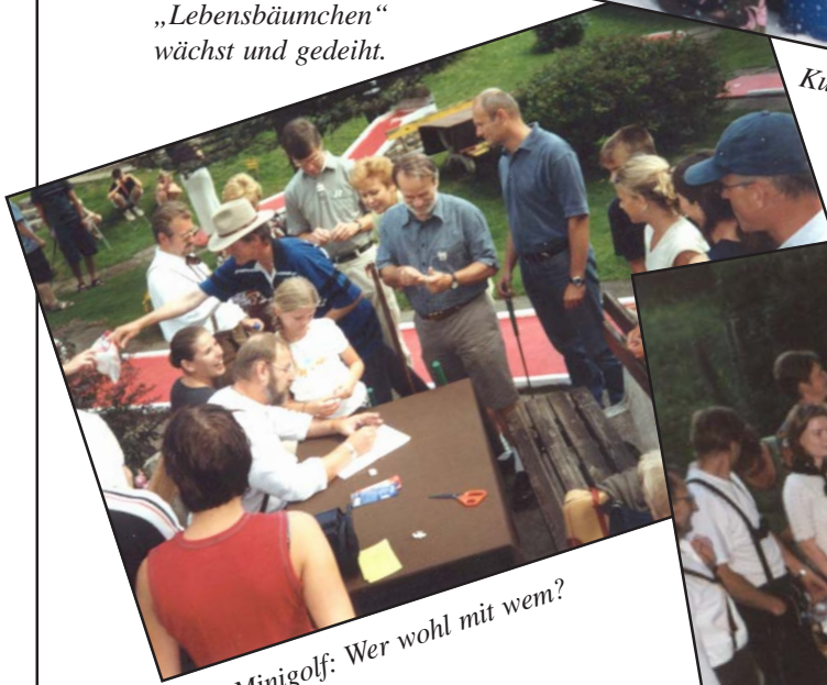
Minigolf: Wer wohl mit wem?