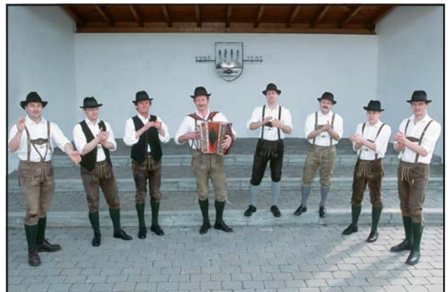
Singan und Poschn liegt eana im Bluat, Sextern und Zwischnposchn, deis kinnans guat.