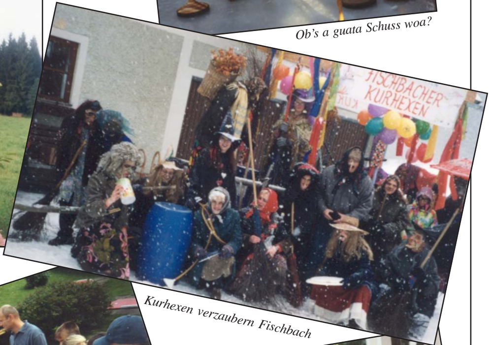
Kurhexen verzaubern Fischbach