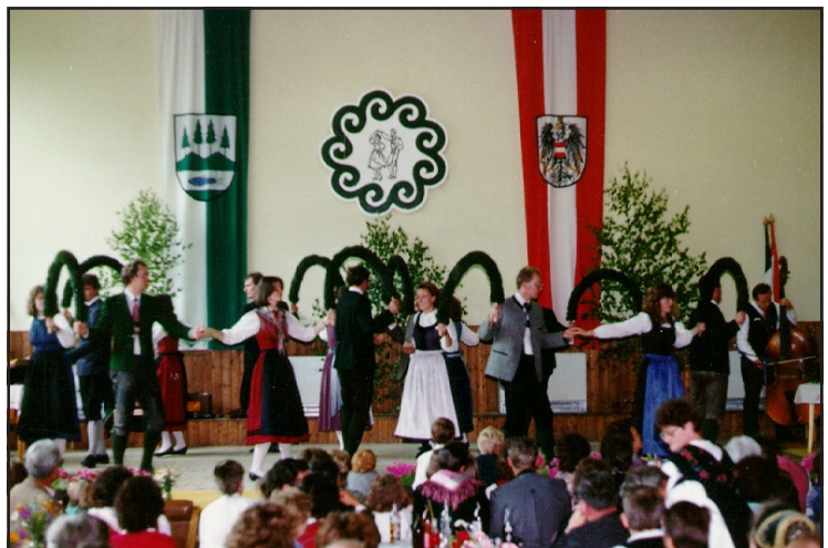
15 Jahre Volkstanzkreis - Jubiläumsfeier