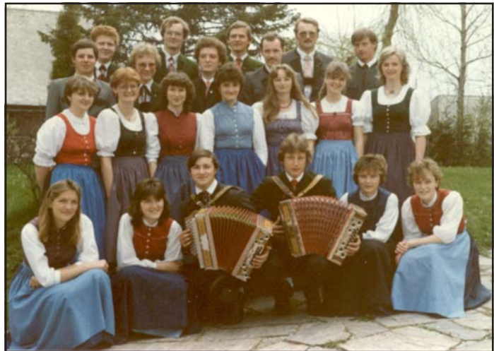
... und dann gings auf nach Schweden (1985).