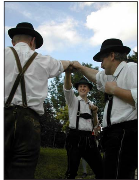
Den Buam, dei vielleicht aufs Schuachplattln spitzn, sei gsogt, do kimmt ma gounz schei ins schwitzn.