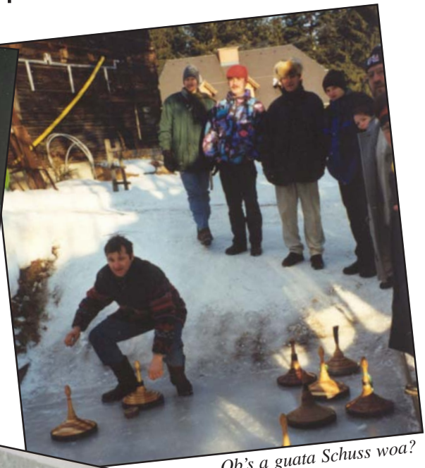
Ob's a guata Schuss woa?