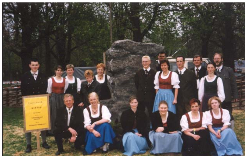
Den Teufelstein nahmen wir uns mit, weil's doch in Wien keinen gibt.