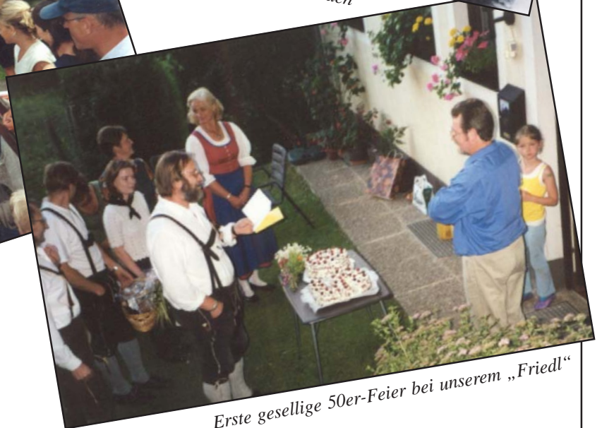
Erste gesellige 50er-Feier bei unserem „Friedl“