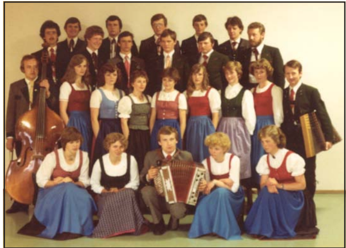
Unsere erste große Auslandsreise - St. Gervais, Frankreich (1980).